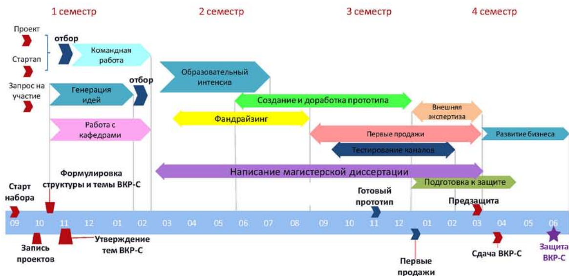
Рис. 2. Этапы подготовки ВКР-С магистра

предпринимательский опыт, либо по результатам прохождения претендентом тестирования (и/или собеседования) в экспертной комиссии. Состав экспертной комиссии утверждается ежегодно приказом по университету.