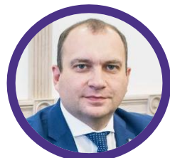
РЫБАКОВ Андрей Алексеевич Председатель Белорусского государственного концерна по нефти и химии «Белнефтехим»