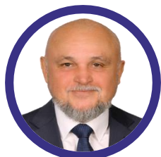
ЦИВИЛЕВ Сергей Евгеньевич Министр энергетики Российской Федерации