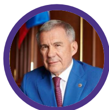
МИННИХАНОВ Рустам Нургалиевич Раис Республики Татарстан