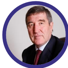
ШАФРАНИК Юрий Константинович Председатель Совета Союза нефтегазопромышленников России