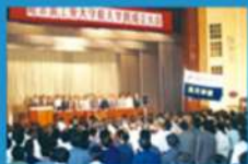
Основан первый институт астронавтики в Китае