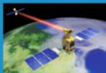
Лидер в области обеспечения лазерной связи между спутником и наземной станцией