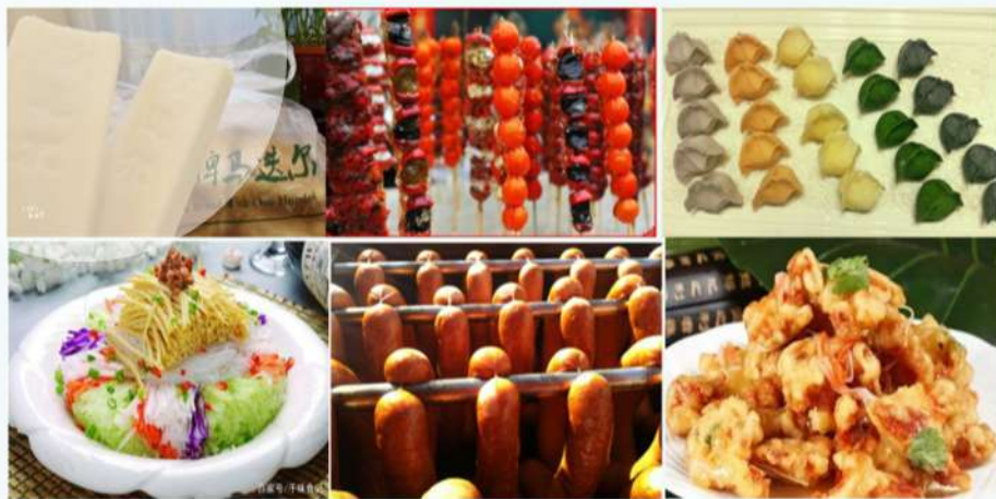
Еда в Харбине