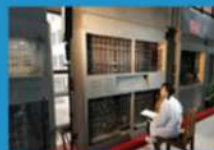
Здесь был разработан первый в Китае интерактивный компьютер для игры в шахматы

ХПУ является первым китайским университетом, который самостоятельно разработал и запустил малые спутники и вывел их на орбиту Луны.